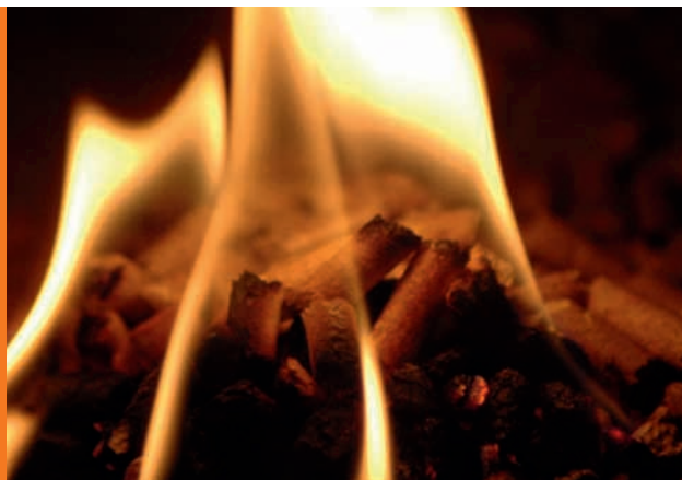
Sauber: Pellets verbrennen klimaneutral und nahezu rückstandsfrei

D eutschlandweit heizen bereits über 100.000 Haushalte mit dem umweltfreundlichen Brennstoff Holzpellets. Dessen Beliebtheit liegt an den vielen Vorteilen der kleinen Sticks.