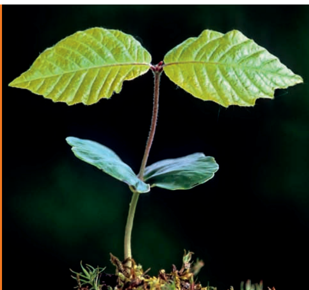
Umweltbewusst: Schon mehr als 100.000 Haushalte heizen mit Pellets