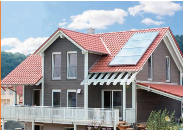
Sonnige Aussichten haben Hausbesitzer mit Pellets und Solarenergie

B eim Heizen mit erneuerbaren Energien ist die Kombination von Pelletheizung und Solaranlage besonders beliebt: Gemeinsam sorgen beide Systeme kostengünstig für eine klimaneutrale Vollversorgung.