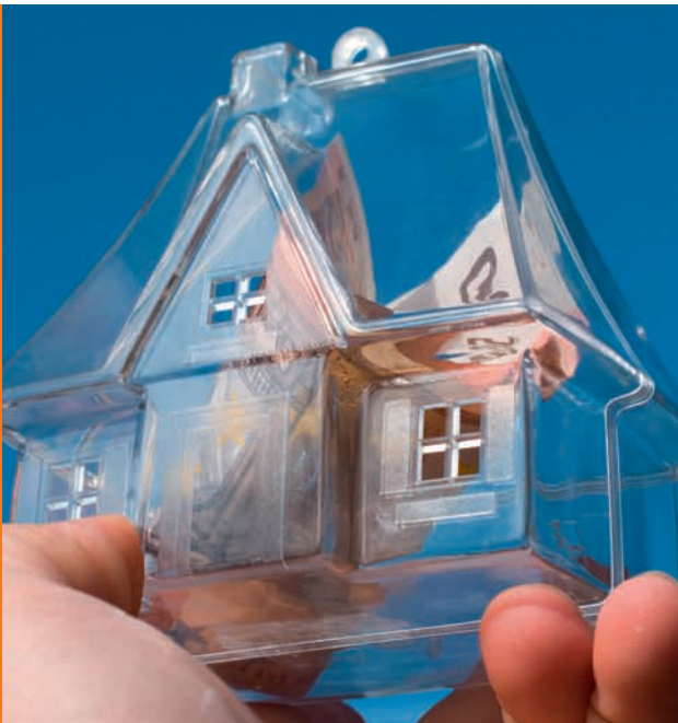
Die Kreditanstalt für Wiederaufbau stellt bis zu 50.000 Euro bereit

A uch die Kreditanstalt für Wiederaufbau (KfW) belohnt umweltbewusste Verbraucher. Das CO 2 -Minderungsprogramm sieht zinsgünstige Darlehen von bis zu 50.000 Euro pro Wohneinheit für die ökologische Sanierung von Gebäuden vor. CO 2 -sparende Investitionen wie der Einbau einer Holzpellettheizanlage können somit zu günstigen Konditionen finanziert werden. Kommunen und Unternehmen können für Anlagen ab 100 Kilowatt spezielle KfW-Darlehen beanspruchen.