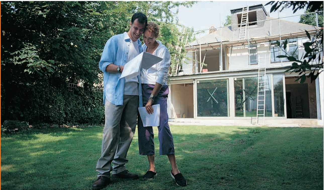
Häuslebauer profitieren: Bis zu 3.600 Euro bekommen sie aus dem Marktanzreizprogramm

A ngesichts der begrenzten Verfügbarkeit fossiler Energieressourcen und aus Umweltschutzgründen fördert die Bundesregierung den Einsatz erneuerbarer Energien im Privatbereich. Da auch Pelletöfen und -heizungen zur Erreichung der Energieeinsparungsziele beitragen und das Klima schützen, schießt der Staat im Rahmen des Marktanzreizprogramms (MAP) beim Kauf einen hohen Geldbetrag zu. In diesem Jahr stehen dafür rund 400 Millionen Euro zur Verfügung.